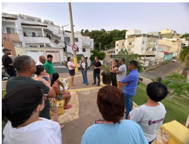
Figura 18 – Programa Afluentes – Diálogo com moradores do Vale Verde