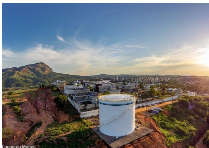
Figura 45 – Reservatório de 3,5 milhões de litros de água para a cidade

Águas de Valadares vai entregar reservatório de 3,5 milhões de litros de água para a cidade