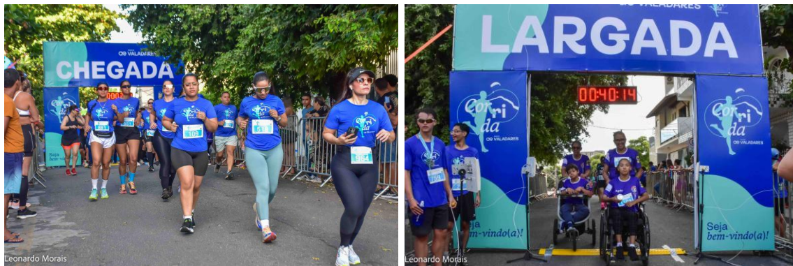
Figura 22 – 1ª Corrida Águas de Valadares reuniu mais de mil atletas

1ª Corrida Águas de Valadares reuniu mais de mil atletas neste domingo (23)