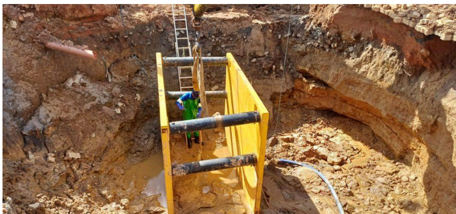
Figura 30 – Obras de substituição da tubulação de esgoto do Estradão do Penha