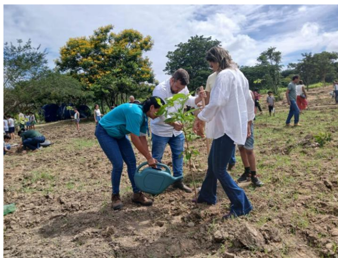
Figura 32 – Plantio de mudas em homenagem ao aniversário da cidade