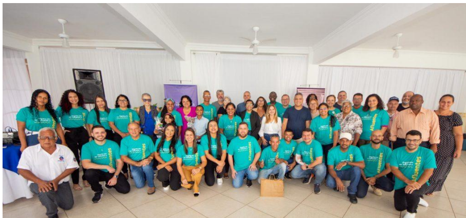
Figura 7 – Programa Afluentes: Reunião com líderes comunitários