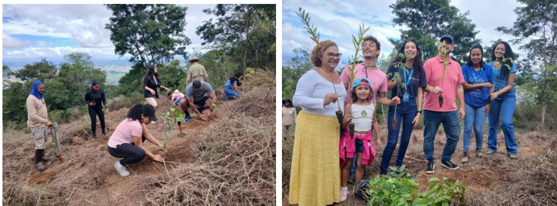
Figura 37 – Plantio de árvores durante a Copa Valadares de Parapente