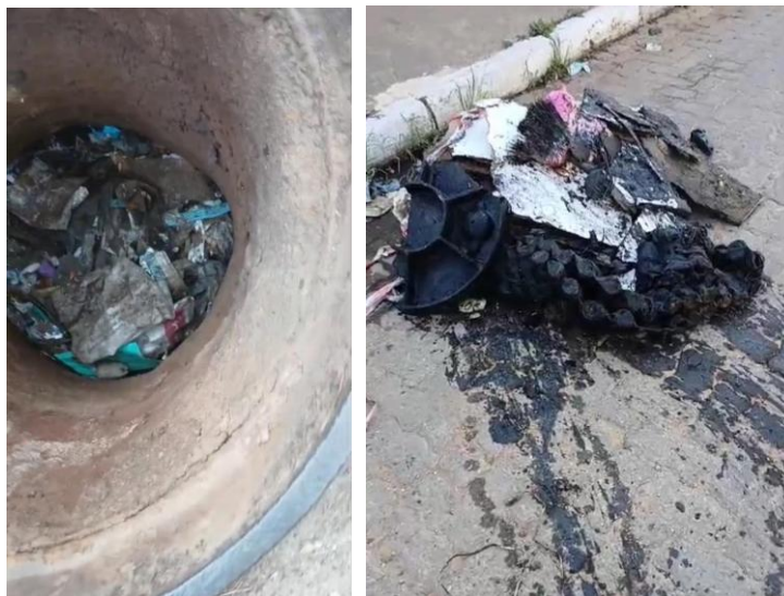
Figura 33 – Mau uso das redes de esgoto: serviços de manutenção e limpeza das redes coletoras

Esgoto: mau uso das redes provoca extravasamentos e transtornos