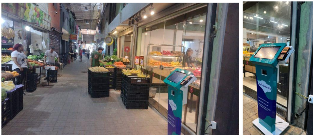
Figura 16 – Instalação de totem de autoatendimento no Mercado Municipal

Águas de Valadares instala totem de autoatendimento no Mercado Municipal