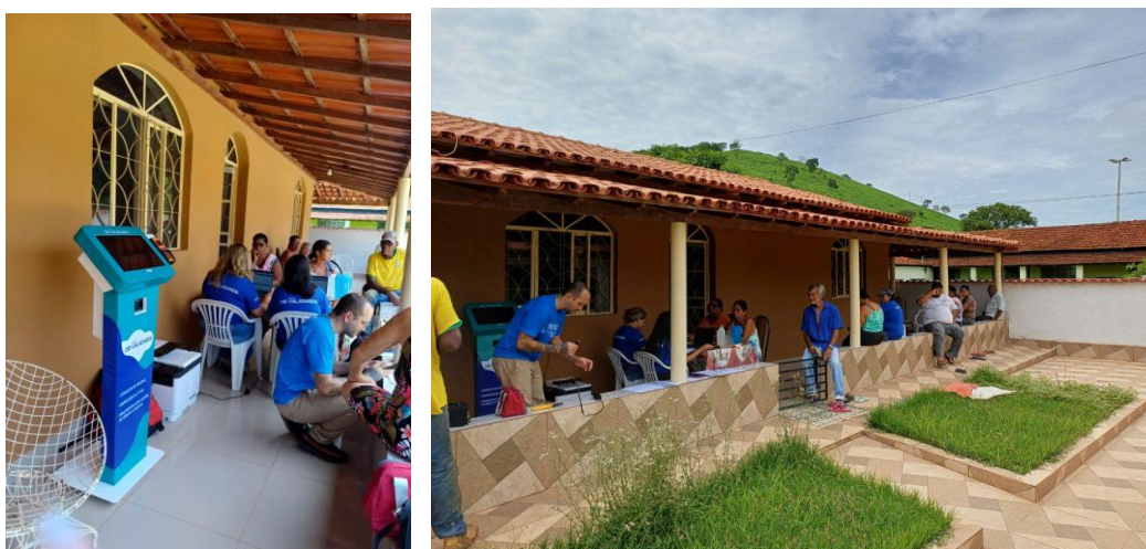
Figura 11 - Ação de atendimento no Distrito Nova Brasília

Águas de Valadares leva serviços ao distrito de Nova Brasília