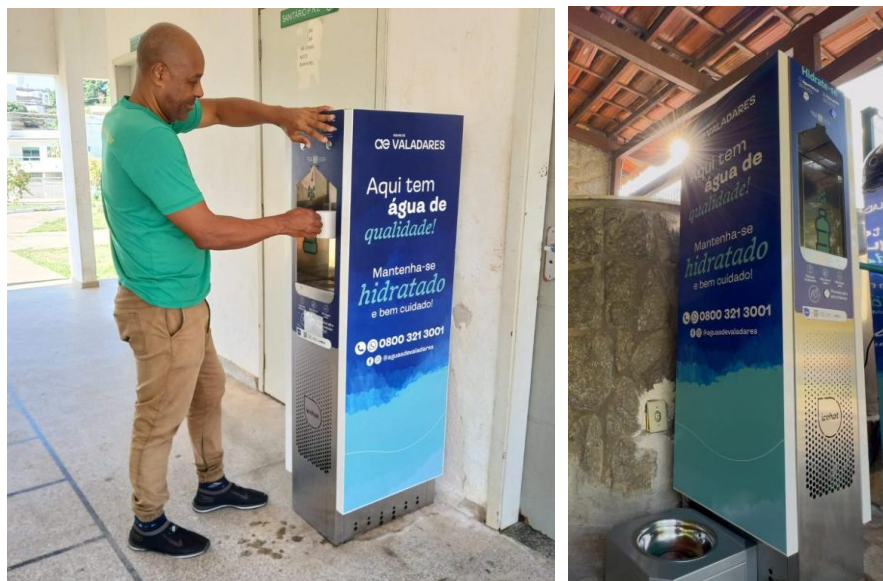
Figura 3 - Instalação bebedouros em pontos estratégicos da cidade

Águas de Valadares e Prefeitura instalam bebedouros em pontos estratégicos da cidade