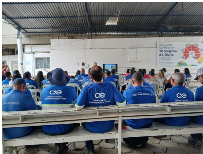
Figura 2 - Outubro Rosa - Palestra educativa para os colaboradores da Águas de Valadares