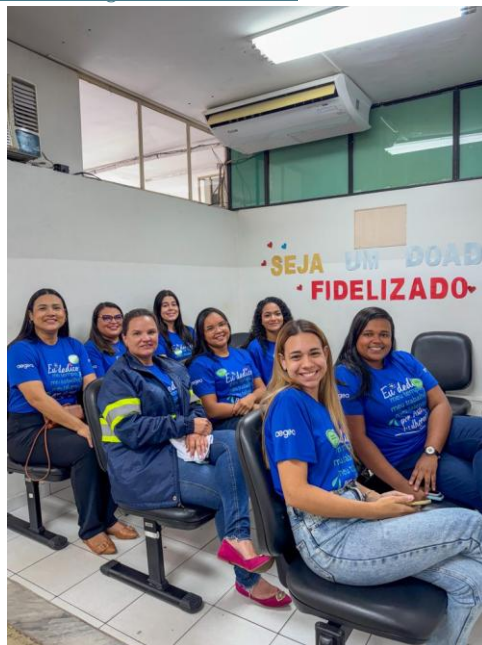
Figura 1 – Outubro Rosa – Campanha de doação de sangue das colaboradoras da Concessionária

Colaboradoras da Águas de Valadares doam sangue no Outubro Rosa