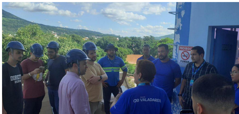
Figura 13 – Programa Portas Abertas - Visita dos professores e alunos da UFJF