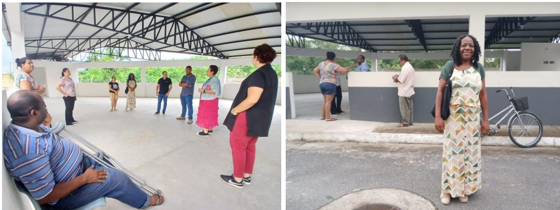
Figura 14 – Apresentação de serviços para melhorias no abastecimento à comunidade