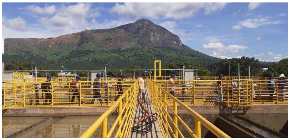
Figura 12 – Programa Portas Abertas - Concessionária recebe recebe professores e alunos da UFJF