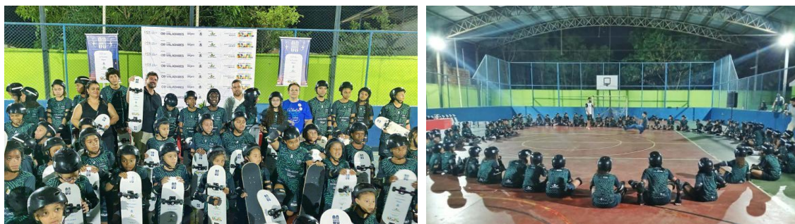
Figura 4 – Águas de Valadares abraça projeto que une esporte e educação através da prática do skate

Águas de Valadares abraça projeto que une esporte e educação através da prática do skate