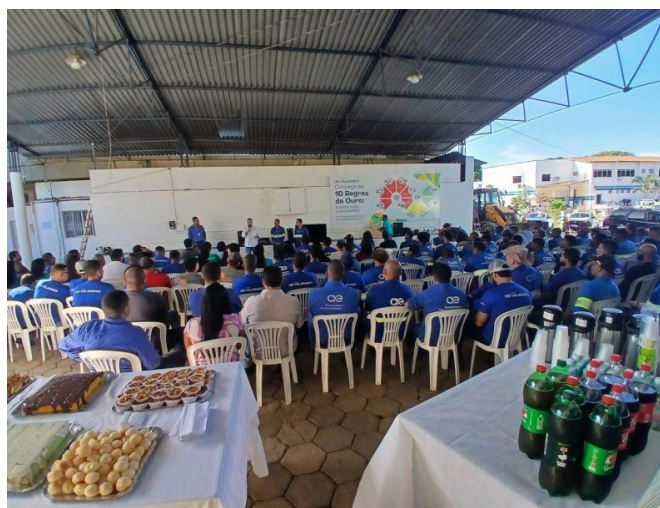
Figura 23 – Palestras e café da manhã especial em comemoração a 100 dias sem acidentes

Palestras e café da manhã especial em comemoração a 100 dias sem acidentes