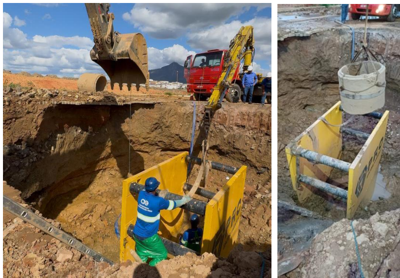
Figura 29 – Obras de substituição da tubulação de esgoto do Estradão do Penha