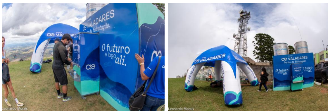
Figura 20 – Ponto de água na Copa Valadares de Parapente

Águas de Valadares é patrocinadora oficial da Copa Valadares de Parapente