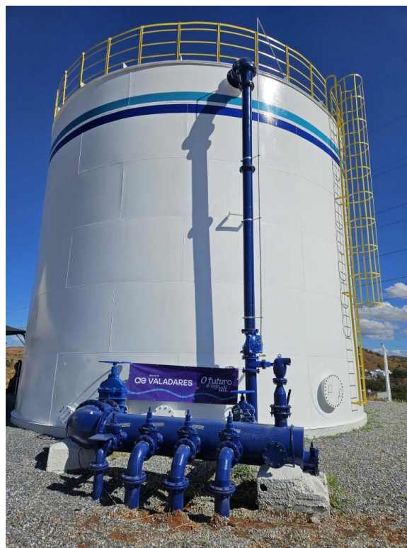
Figura 39 – Reservatório de 800 mil litros colocado em operação no Morada do Vale