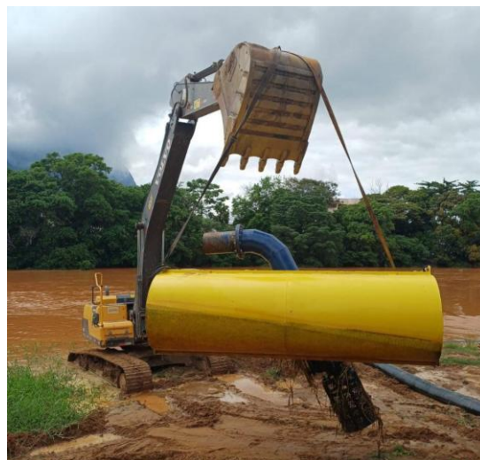
Figura 43 – Atualização do sistema de captação da ETA Central