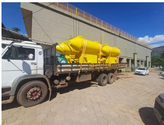
Figura 47 – Ações realizadas - Plano de Contingência contra efeitos das cheias-Melhorias na captação

Águas de Valadares adota Plano de Contingência contra efeitos das cheias