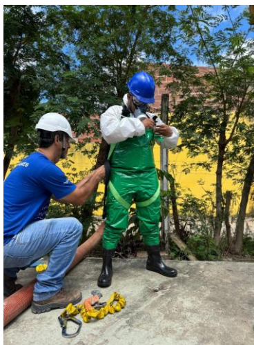
Figura 34 – Serviços de manutenção e limpeza das redes coletoras