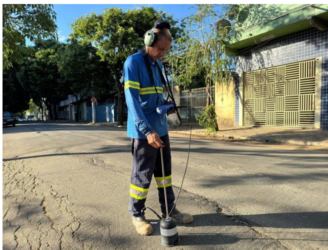
Figura 44 – Águas de Valadares utiliza tecnologia para identificar vazamentos não visíveis