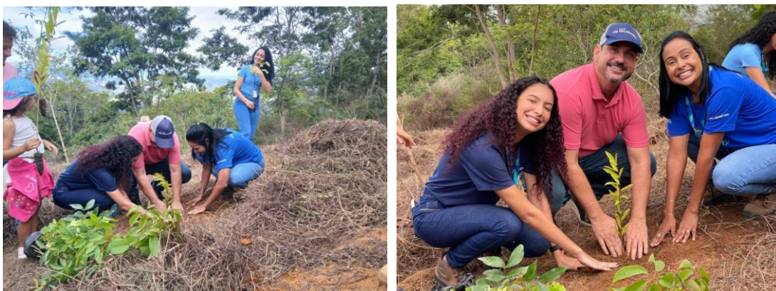
Figura 36 – Ação ambiental durante a Copa Valadares de Parapente

Plantio de mudas no Pico da Ibituruna abre Copa Valadares de Parapente e Mês da Água