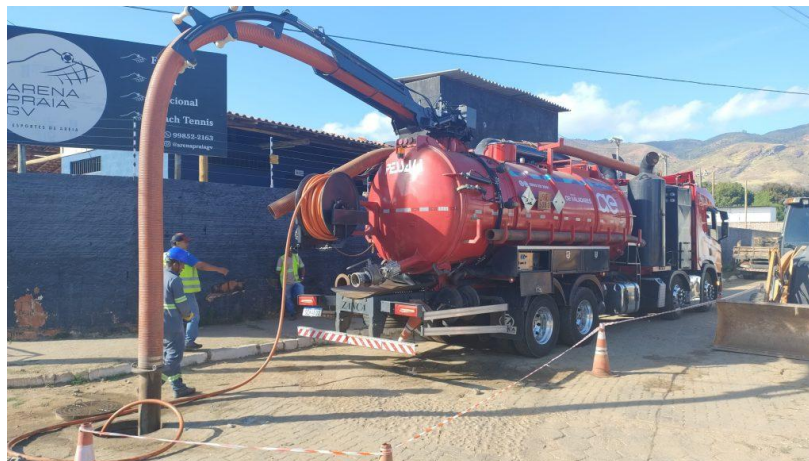
Figura 35 – Serviços de manutenção e limpeza das redes coletoras