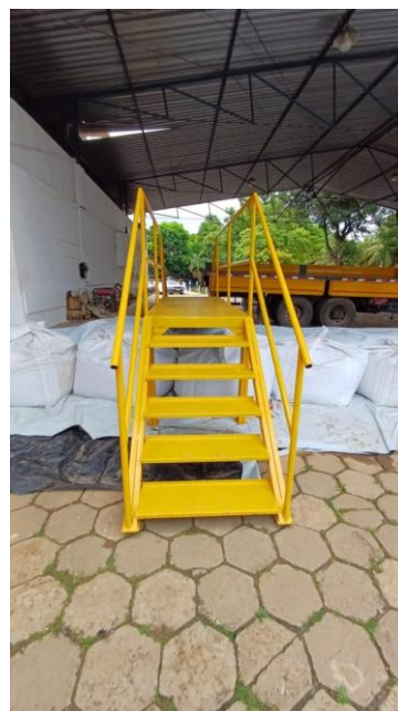
Figura 48 – Ações realizadas - Plano de Contingência contra efeitos das cheias- Barreira de proteção