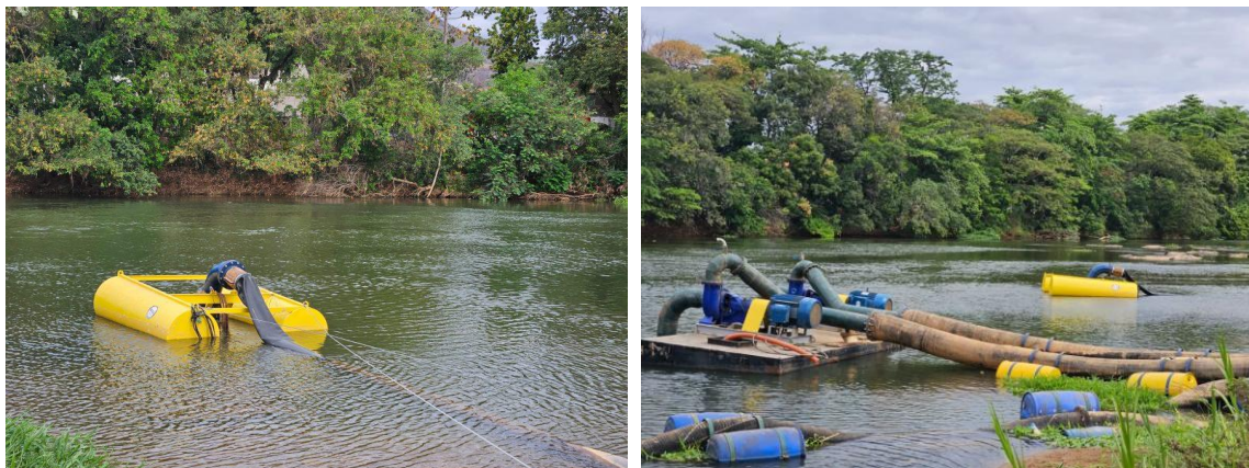
Figura 40 – Investimento em novos equipamentos e tecnologia para enfrentar estiagem