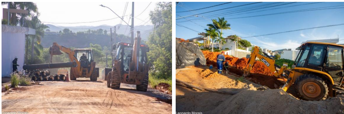
Figura 46 – Obras de interligação do reservatório