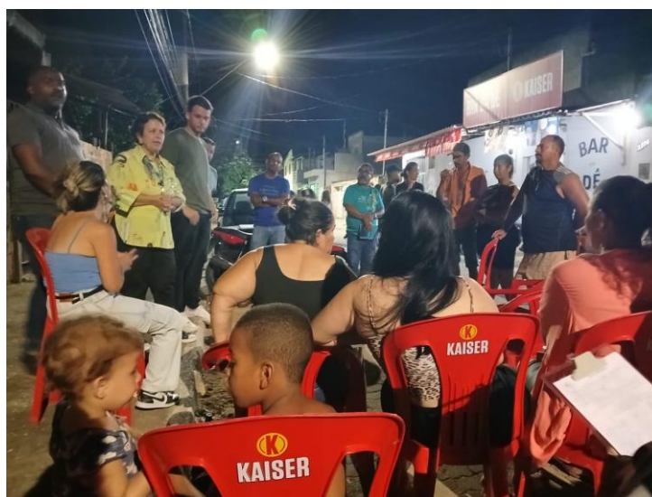
Figura 26 – Encontros com as comunidades na Semana da Água