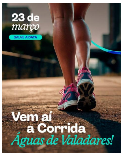
Figura 19 – Programa Afluentes – Diálogo com moradores do Vale Verde

Inscrições abertas para a primeira Corrida Águas de Valadares