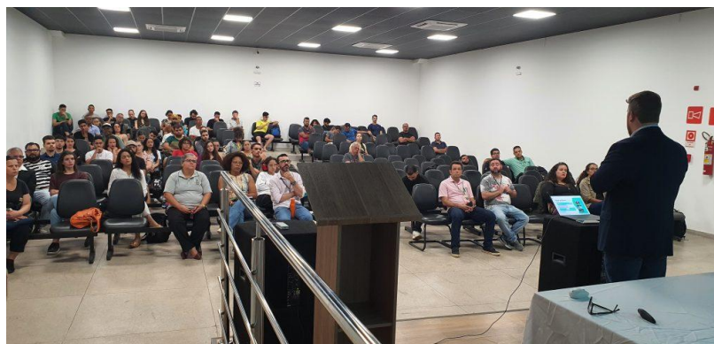
Figura 8 – Participação da Concessionária na Semana Acadêmica do IFMG

Águas de Valadares participa da Semana Acadêmica do IFMG