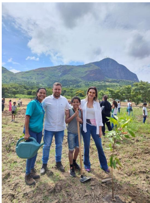
Figura 31 – Plantio de mudas em homenagem ao aniversário da cidade