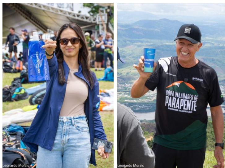
Figura 21 – Distribuição de brindes para hidratação na Copa Valadares de Parapente