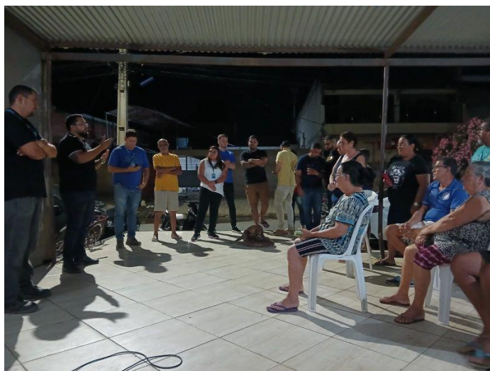
Figura 28 – Reunião para anunciar as obras de melhorias no abastecimento do Santa Rita

Águas de Valadares faz melhorias no abastecimento do Santa Rita