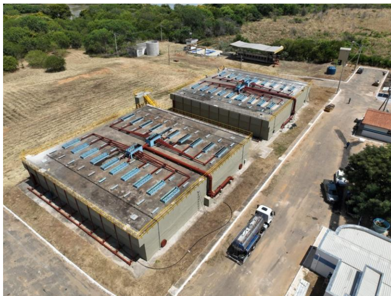
Figura 38 – Início da operação da ETE Santos Dumont

Águas de Valadares inaugura Estação de Tratamento de Esgoto (ETE) Santos Dumont no Dia Mundial da Água