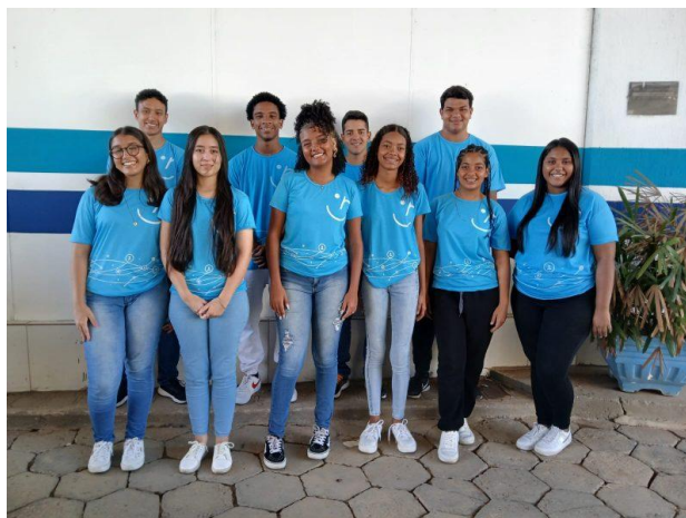
Figura 10 – Águas de Valadares adota programa Jovem Aprendiz

Águas de Valadares adota programa Jovem Aprendiz