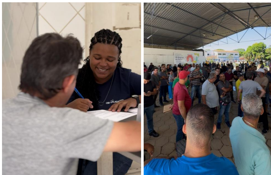
Figura 17 - Mutirão de empregos da Águas de Valadares atraiu mais de 400 candidatos