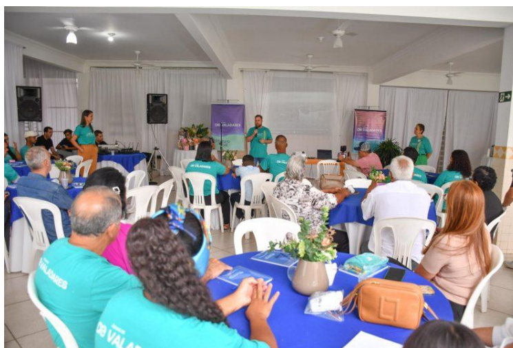
Figura 6 – A Concessionária reuniu líderes comunitários para balanço e agradecimento

Águas de Valadares reúne líderes comunitários para balanço e agradecimento