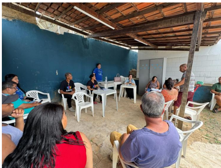
Figura 27 – Encontros com as comunidades na Semana da Água