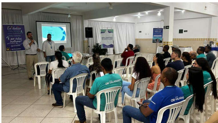
Figura 25 – Encontros com as comunidades na Semana da Água