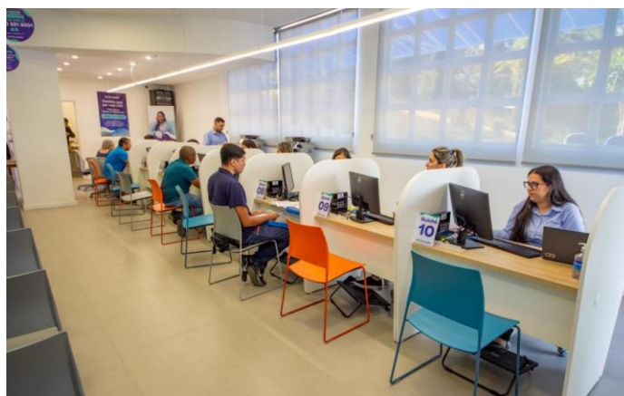
Figura 9 – Campanha de descontos para clientes com faturas atrasadas

Águas de Valadares lança campanha de descontos para quem tem faturas atrasadas