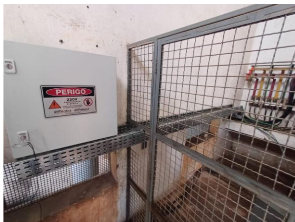
Figura 42 – Manutenção preventiva no sistema elétrico da ETA Central