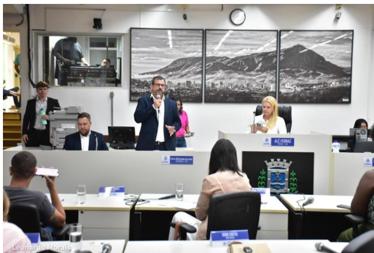
Figura 24 – Apresentação de entregas e cronograma de obras na Câmara Municipal

Águas de Valadares apresenta entregas e cronograma de obras na Câmara Municipal