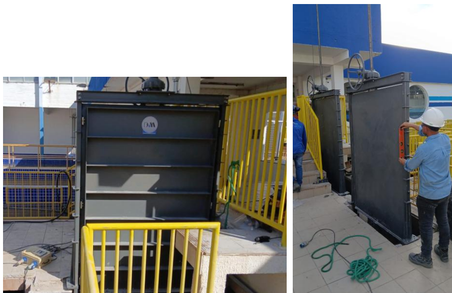
Figura 41 – Instalação de comportas na ETA Central

Manutenções na ETA Central modernizam sistema de captação, tratamento e distribuição de água